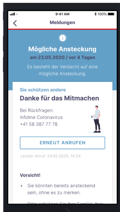
Abb. 1: SwissCovid App : Représentation d'un contact possible avec un cas de COVID-19

L'analyse pour la COVID-19 (par PCR et / ou par sérologie) peut également être réalisée chez des personnes ayant eu un contact étroit avec un cas de COVID-19, qui sont asymptomatiques et se trouvent en quarantaine sur décision des autorités. L'indication à effectuer l'analyse est posée par le service cantonal compétent (le médecin cantonal ou le service de traçage de contact qui l'a